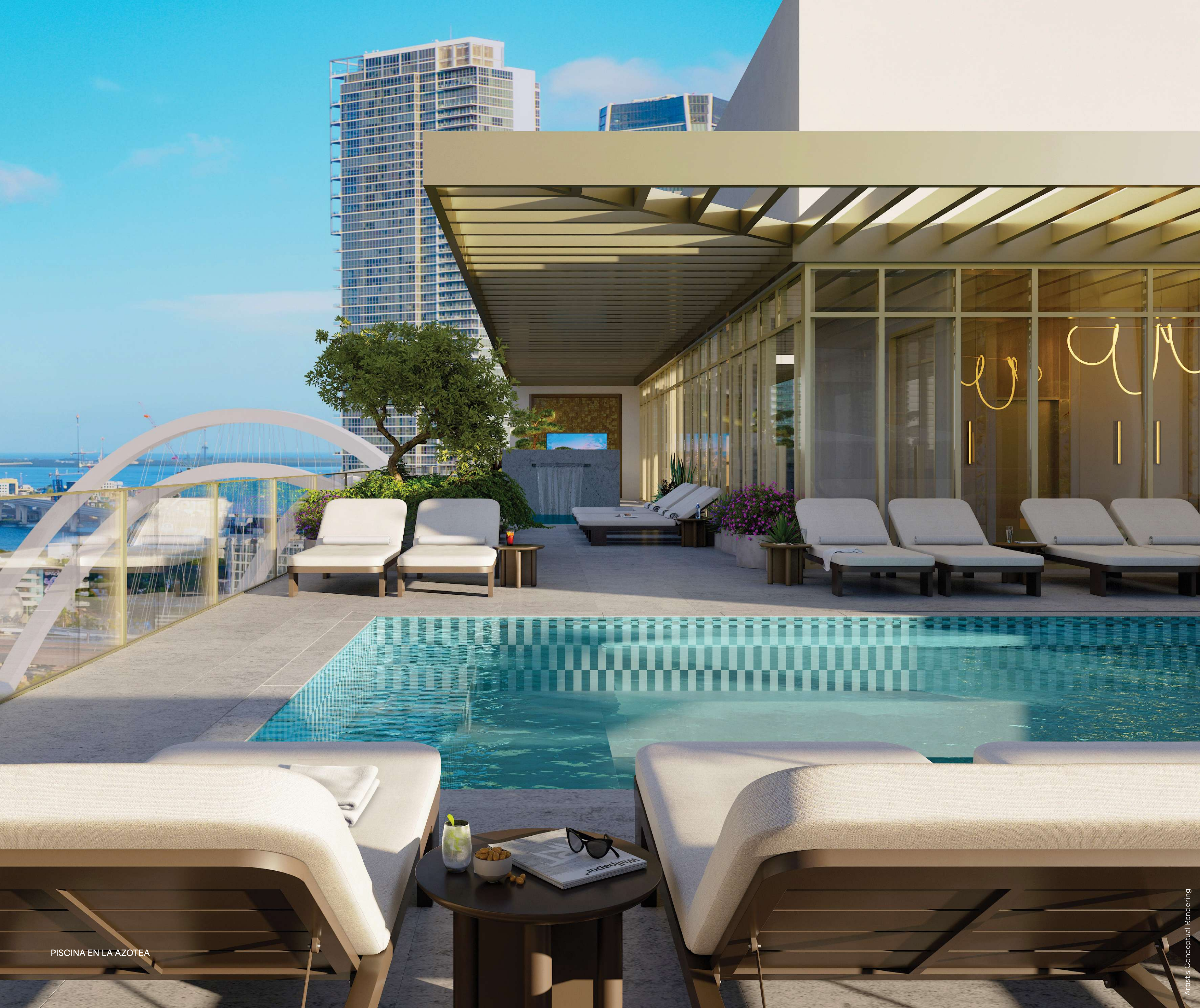
PISCINA EN LA AZOTEA