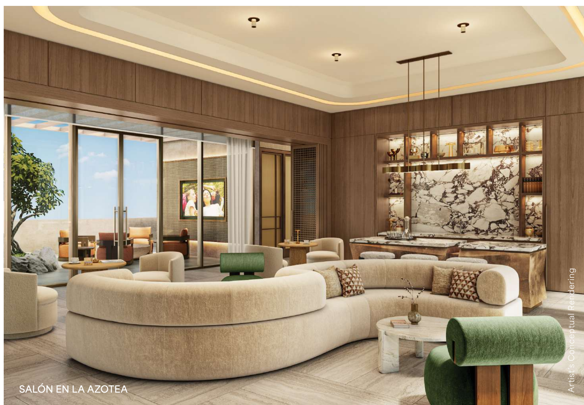
SALÓN EN LA AZOTEA