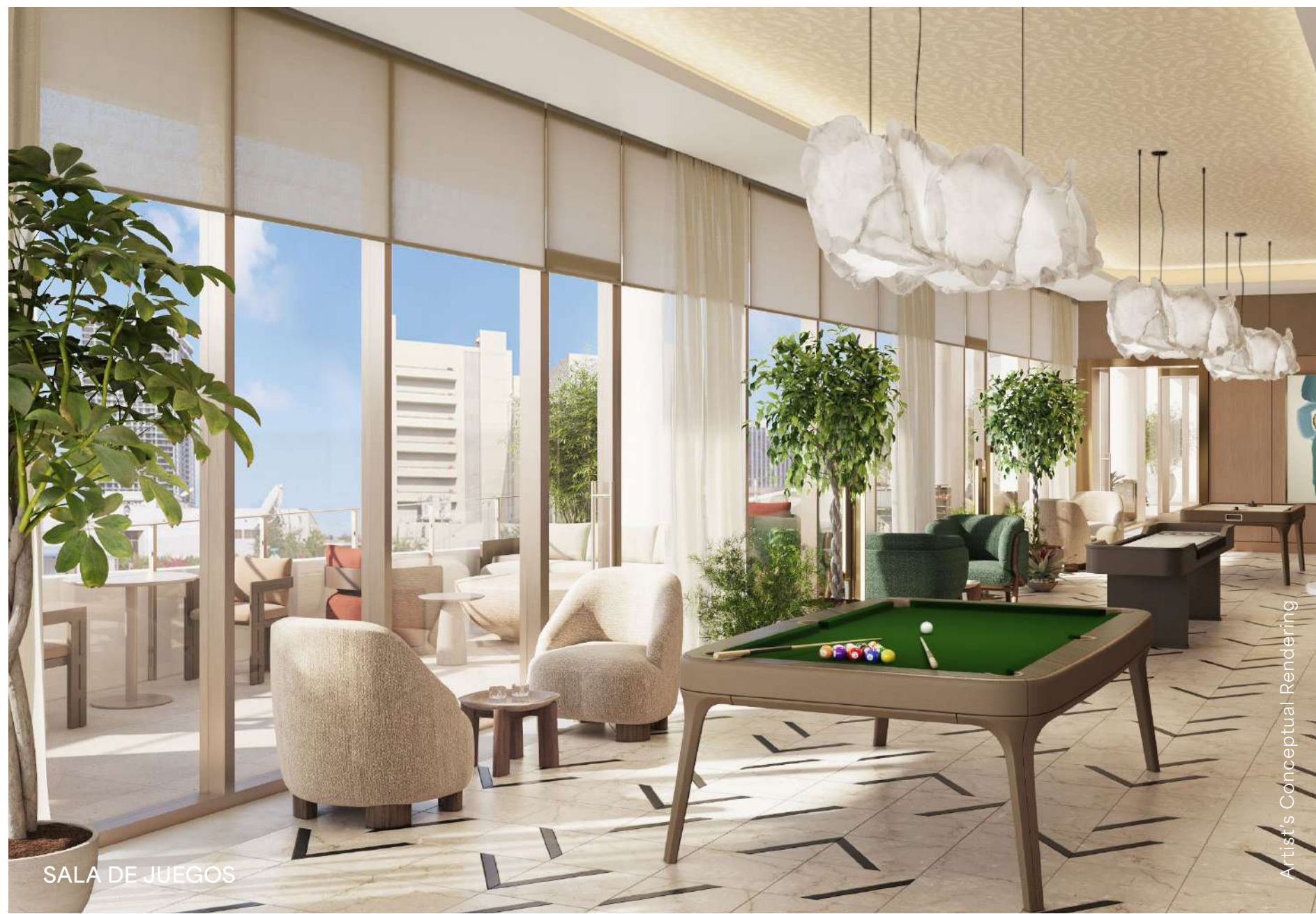
SALA DE JUEGOS