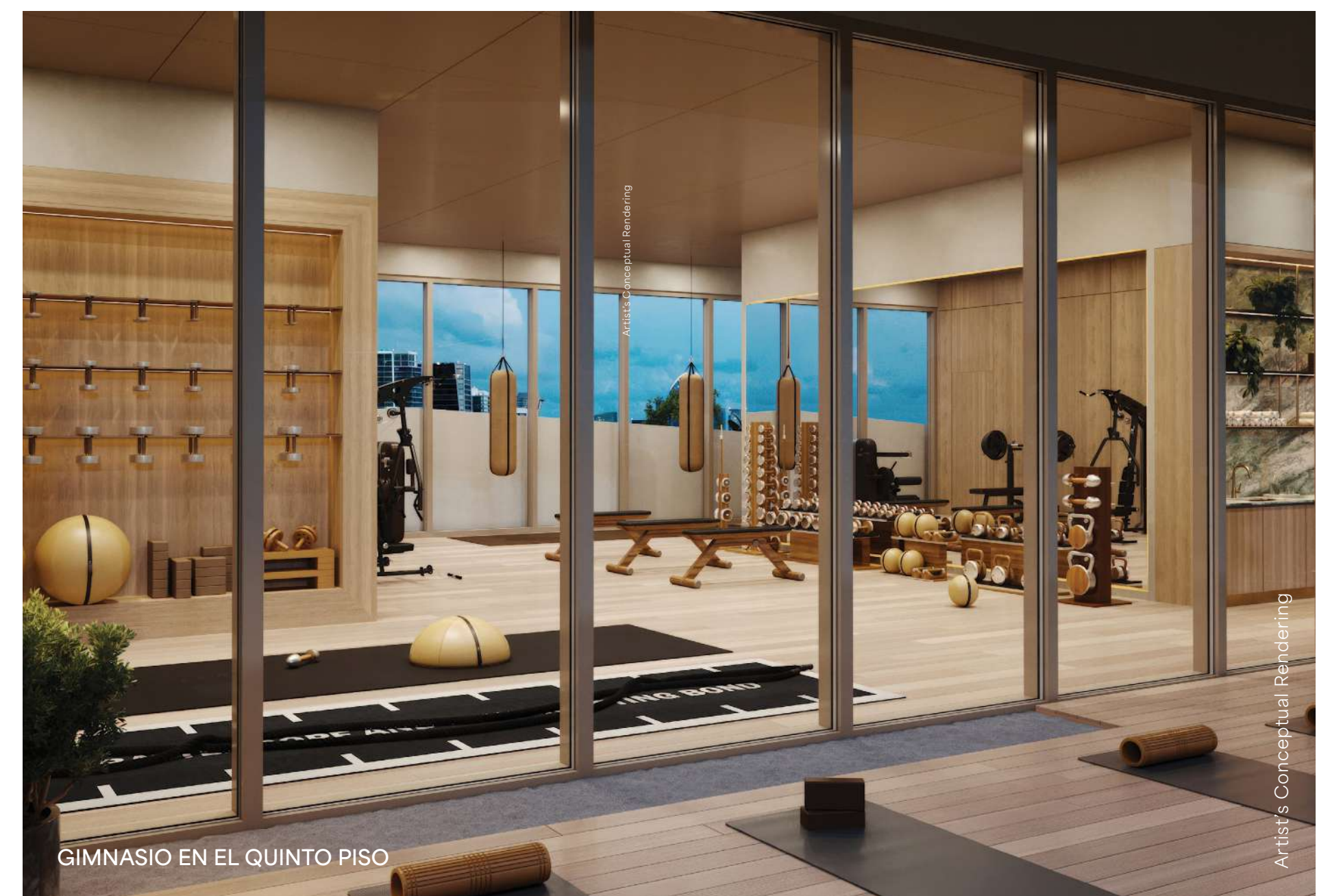
GIMNASIO EN EL QUINTO PISO